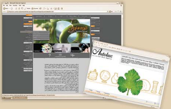
وب و مالتی مدیا