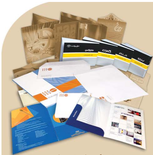
ست اوراق اداری، کاتالوگ، بروشور، کتاب و فولدر