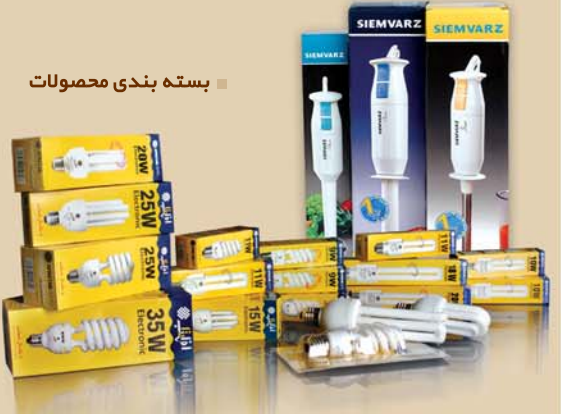
بسته بندی محصولات