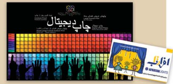
پوستر و آگهی تبلیغاتی