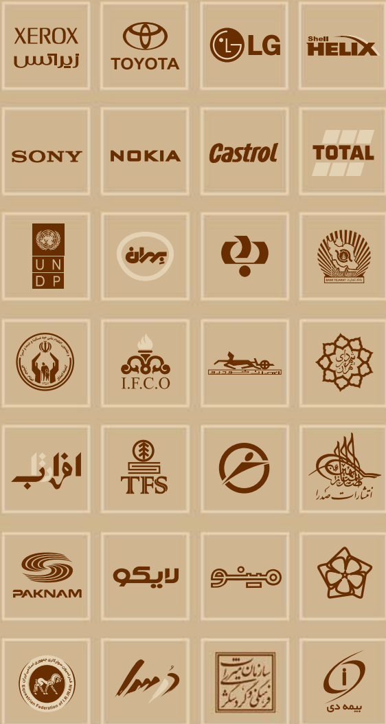
تعدادی از کارفرمایان استودیو طراحی ساروبن