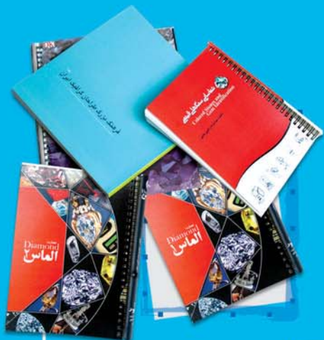
و انواع صحافی چاپ کتاب

هم اکنون سریعترین دستگاه چاپ رنگی ورقی و سریعترین دستگاه چاپ سیاه و سفید با بالاترین کیفیت موجود در بازار ایران، در شرکت ساروبن مشغول به کار است. شرکت ساروبن در زمینه چاپ های رنگی و سیاه و سفید با انواع کیفیت به مشتریان خود ارائه خدمات می‌نماید.