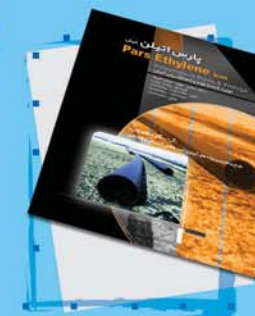
کاتالوگ و ...